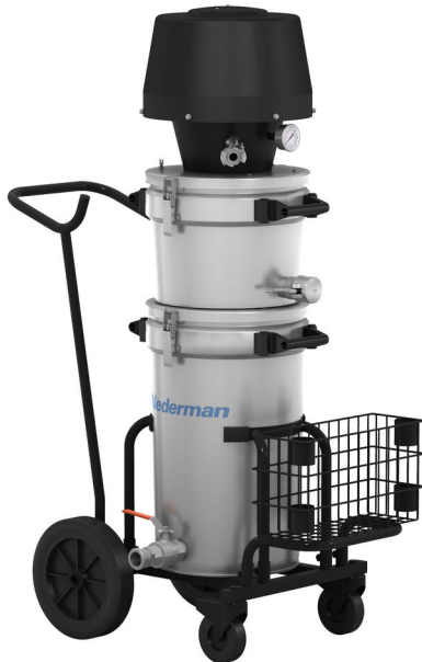
Industrial vacuum cleaner 140A EX

Aspirador industrial ATEX para a extração de líquidos inflamáveis e nocivos.